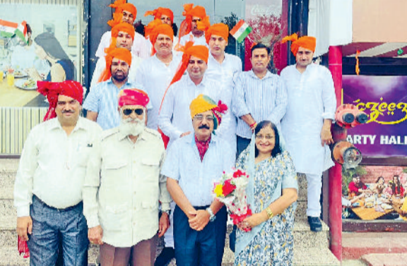
फतेहाबाद। अतिथियों का स्वागत करते क्षत्रिय राजपूत महासभा के पदाधिकारी।