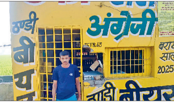
रतिया। शराब टेके पर हुई चोरी की जानकारी देता हुआ कार्रिदा।