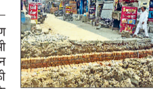
रतिया। सड़क निर्माण के चलते बंद हुआ रास्ता।

शहर में फोरलेन सड़क के निर्माण के बाद बरसाती पानी की निकासी के लिए बनाए जा रहे नाले के दौरान ठेकेदार एवं कर्मचारियों की लापरवाही के कारण नगर के राहगीरों एवं दुकानदारों को काफी परेशानी का सामना करना पड़ रहा है। नाले के निर्माण के दौरान संपर्क बाजारों की पुलियां तोड़ देने से उन बाजारों का संपर्क मुख्य सड़क से टूट गया है। पेयजल सप्लाई की पाइपें तोड़ दी गई हैं। सीवरेज की पाइपें भी टूट गई हैं, जिस कारण आम लोग परेशान हैं। सिटी वेलफेयर क्लब रतिया के अध्यक्ष