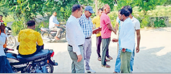
फतेहाबाद। युवाओं को जागरूक करते जिला पुलिस की नशा मुक्ति टीम सदस्य।