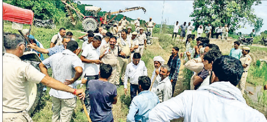
भूना। बिजली पोल लगाने का विरोध करते किसान।